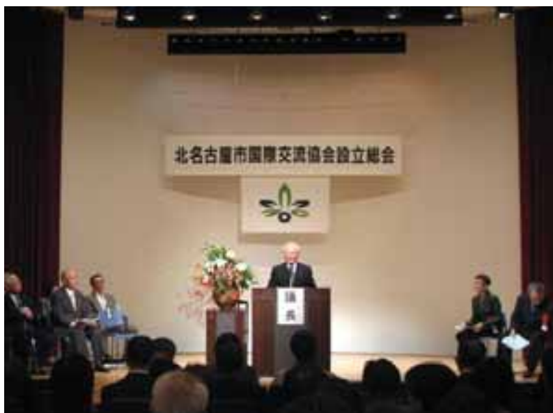
北名古屋市国際交流協会設立総会の様子

平成19年10月27日に、総合福祉センターもえの丘ふれあい健康ルームにおいて、北名古屋市国際交流協会設立総会を開催しました。総会当日は、雨にもかかわらず、約60名の会員の出席があり、予定していた議事もすべて承認され、北名古屋市国際交流協会が設立されました。